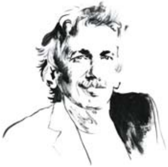
Dr. Wolfgang Bachmann Herausgeber