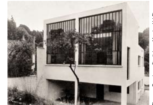
Theo van Doesburg, Studiohaus Meudon-Vail-Floury, um 1930