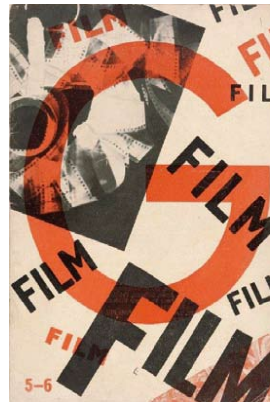
Cover der Zeitschrift G. Material für elementare Gestaltung , hg. v. Hans Richter, Ausgabe 5/6, April 1926