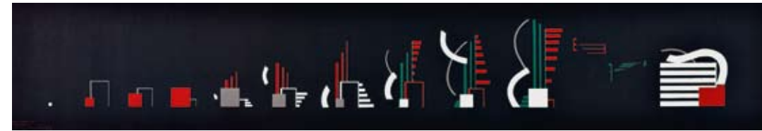
Hans Richter, Rhythmus 23 , 1923, Siebdruck auf Leinwand, Slg. Kunstmuseen Krefeld