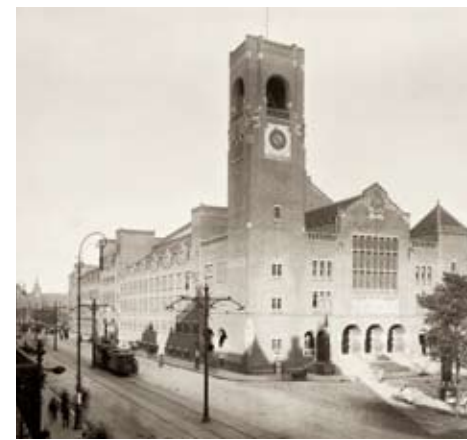
Hendrik Petrus Berlage, Börse Amsterdam, 1896 – 1903

Man stelle sich ganz viele rechteckige oder sogar quadratische Schachteln vor, die neben- und übereinander gestapelt sind. Die Schachteln haben viele rechteckige Öffnungen, durch die man ungewöhnliche Einblicke in das Schachtelhaus gewinnt. Noch spannender wird es dadurch, dass die Wände, Decken oder sogar Fußböden nicht weiß sind, sondern blau oder gelb oder rot. Das kann ganz schön verwirrend sein und dennoch ist alles geometrisch und klar. Einige Künstler und Architekten haben vor knapp 100 Jahren so gedacht und geplant, zum Beispiel der niederländische Künstler Theo van Doesburg. In diesem Workshop schlüpfen wir in seine Rolle und bauen aus einfachen Schachteln tolle Skulpturen und Modelle.